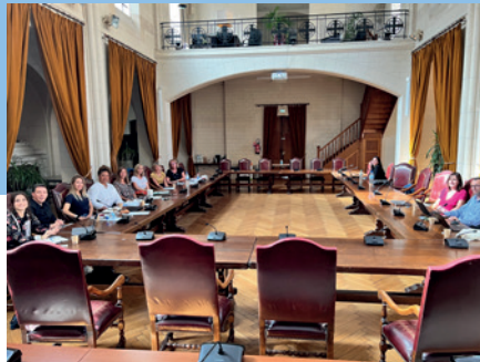
Journée d'accueil à l'occasion de l'adhésion d'Hauts-de-Seine Habitat

2022 marque également l'adhésion d'Hauts-de-Seine Habitat au GIE, dont le patrimoine (42 000 logements) sera intégré sur la plateforme au 1 er trimestre 2023.